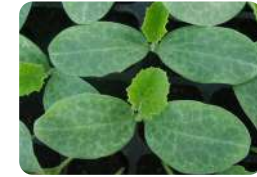
ต้นฟักทองเริ่มมีใบจริง