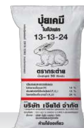
13-13-24 อัตรา 25-30 กก./ไร่