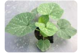
ระยะมีใบจริง 4-5 ใบ