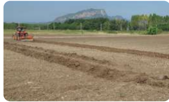
การเตรียมแปลง