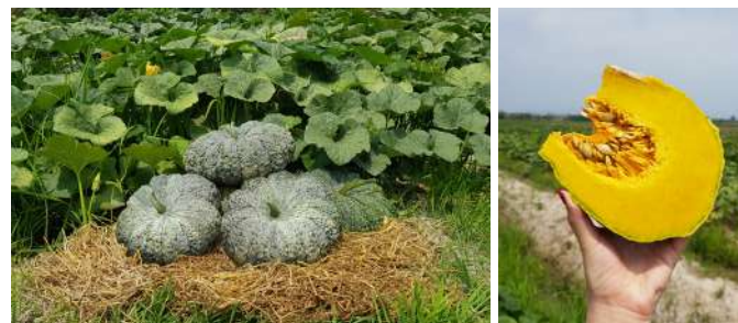
รูปความสวยงามของผลผลิต