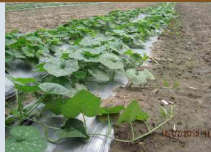
ระยะเลื่อย ทอดยอด ก่อนออกดอก (อายุ 25-30 วัน)