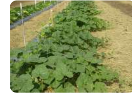
การจัดแถว