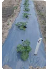
การยกร่องและคลุมแปลง