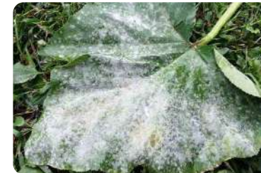
ภาพแสดงลักษณะโรคราแป้ง