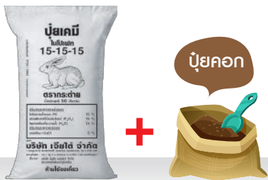
15-15-15 อัตรา 25-30 กก./ไร่ ปุ๋ยคอก อัตรา 200-400 กก./ไร่