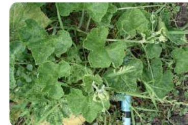
ภาพแสดงลักษณะใบหงิกจากไวรัส