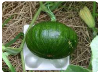
การรองฟักทองด้วยถาดโฟม เพื่อป้องกันโรคเพลี้ย