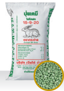
15-9-20 อัตรา 25-30 กก./ไร่