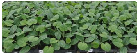
การเพาะกล้าในถาด