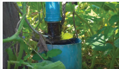
บิมซิมเมอร์ส เจาะลงไปใต้ดิน ลึก 50 เมตร

พื้กทองปลุกได้ทั่วประเทศไทย ใช้น้ำในปริมาณน้อย แต่หากปลูกบนพื้นที่ใหญ่ปริมาณน้ำไม่เพียงพอ แนะนำให้ติดตั้งบิมบาดาล หรือ บิมซิมเมอร์ส เพื่อความสะดวกและให้ได้ปริมาณน้ำที่เพียงพอกับที่