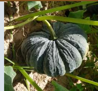
ระยะบำรุงผล สร้างเนื้อ (อายุ 65-75 วัน)