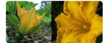
ดอกเพศเมีย