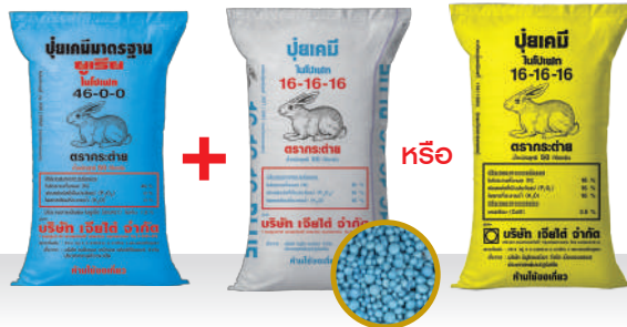
46-0-0 อัตรา 10 กก./ไร่ 16-16-16 Blue หรือ 16-16-16 อัตรา 25-30 กก./ไร่