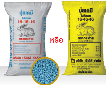
16-16-16 Blue หรือ 16-16-16 อัตรา 25-30 กก./ไร่