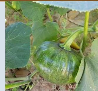
ระยะหลังพสมทกสร- เริ่มติดผล (อายุ 45-55 วัน)