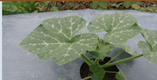
ระยะบำรุงต้น (เริ่มมีใบจริง 3-4 ใบ) (อายุ 10-14 วันหลังจากงอก)