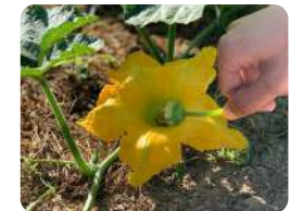
แต้มเกสรดอกตัวผู้บนเกสรดอกตัวเมีย