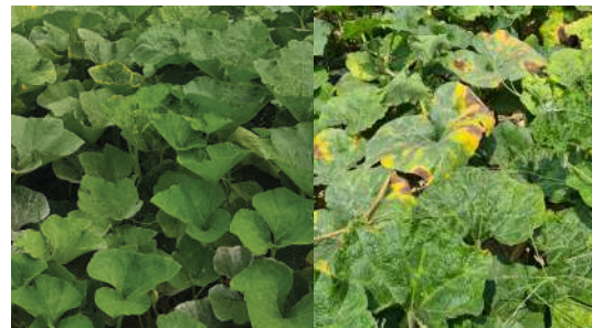
รูปเปรียบเทียบทองสยาม vs พันธุ์อื่น