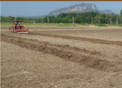
เตรียมดิน รองพื้น