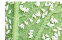
ภาพแมลงหวี่ขาว